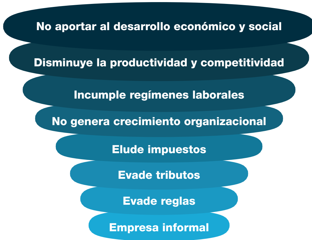
Figura 2. Torbellino ocasionado por las empresas informales