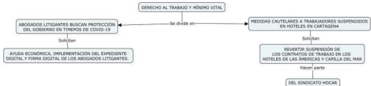
Figura 5. Afectación al derecho al trabajo y al mínimo vital en tiempos de Covid-19.