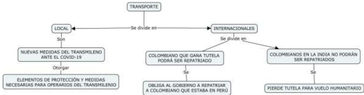
Figura 4. Noticias locales e internacionales relacionadas con tutelas con ocasión de diferentes medios de transporte.