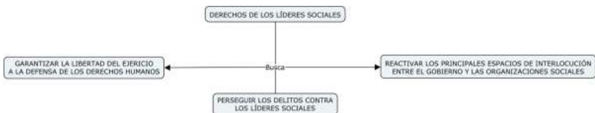
Figura 7. Derechos de los líderes sociales en tiempos de Covid-19.