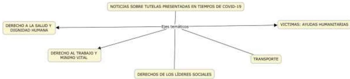
Figura 2. Derechos de las acciones de tutela invocados con más frecuencia.

Derecho a la salud, dignidad humana, trabajo, mínimo vital, transporte, ayudas humanitarias y derechos de los líderes sociales.