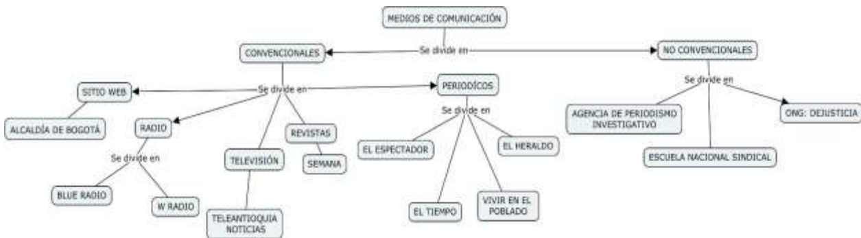
Figura 1. Mapas medios de comunicación convencionales y no convencionales utilizados para la extracción de información.