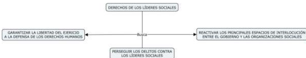
Figura 7. Derechos de los líderes sociales en tiempos de Covid-19.