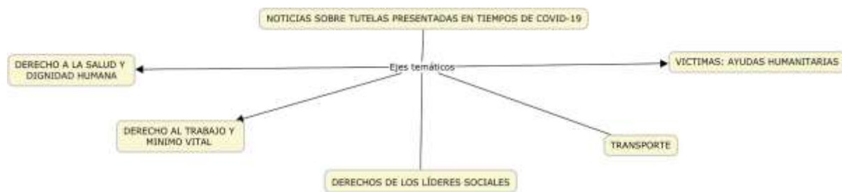
Figura 2. Derechos de las acciones de tutela invocados con más frecuencia.

Derecho a la salud, dignidad humana, trabajo, mínimo vital, transporte, ayudas humanitarias y derechos de los líderes sociales.