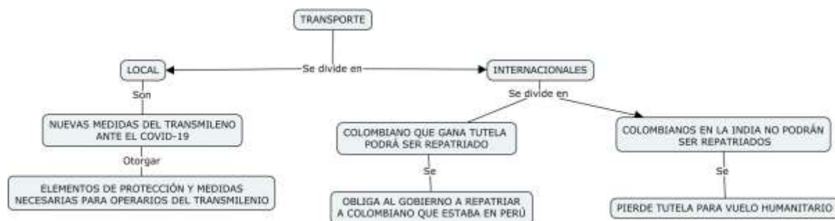
Figura 4. Noticias locales e internacionales relacionadas con tutelas con ocasión de diferentes medios de transporte.