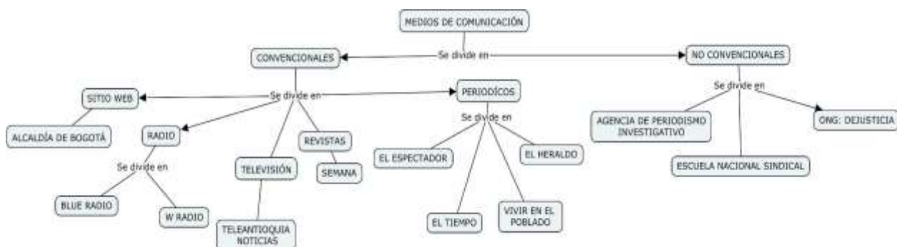
Figura 1. Mapas medios de comunicación convencionales y no convencionales utilizados para la extracción de información.