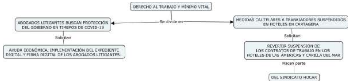
Figura 5. Afectación al derecho al trabajo y al mínimo vital en tiempos de Covid-19.